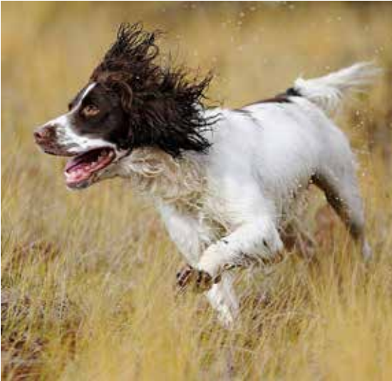
Prøvevinner Rogaland 3.11. NJCH Streamside`s Kill Devil.