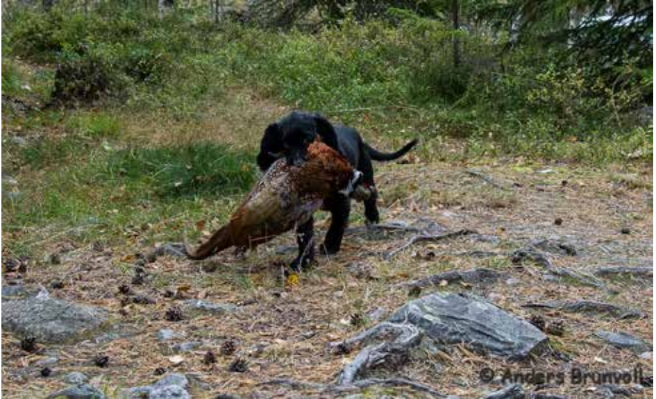
Abby ca 13 uker gammel apporterer kald fasan for første gang.