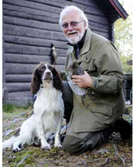
Tiur er stas!

Kill har 5x1EK i Norge, for fire forskjellige dommere, to av dem svenske. Han vant NSKs jubileumsprøve 2010, Rogalandsprøven 3.november 2012, og ble nr. 2 i årets jaktspaniel 2010. Han er flere ganger blitt valgt til skytternes favoritt (gun's choice). Kill er Streamside's femte jaktchampion.