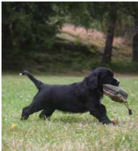
Abby med godt grep om dummien, i god fart tilbake til pappa: "Nå skal pappa bli glad for å få denne!"

drasser/ - liggeundelagt til bilbur, noen svært kostbare. Vi har erfart at det ikke nødvendigvis er de dyreste som har vært best til vårt bruk. Det viktigste er at hunden ligger stødig og tørt.