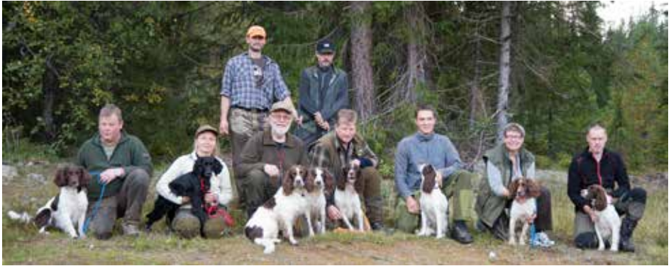
Prøvedeltakere jaktprøven på Støren 16.09.