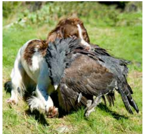
Prøvens beste hund i Rogaland