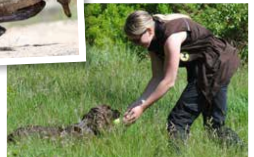
Hollyoaks Kviss i god fart inn med apportert kaldt vilt.

enten det er dummies, gjenstander, kaldt eller varmt vilt.