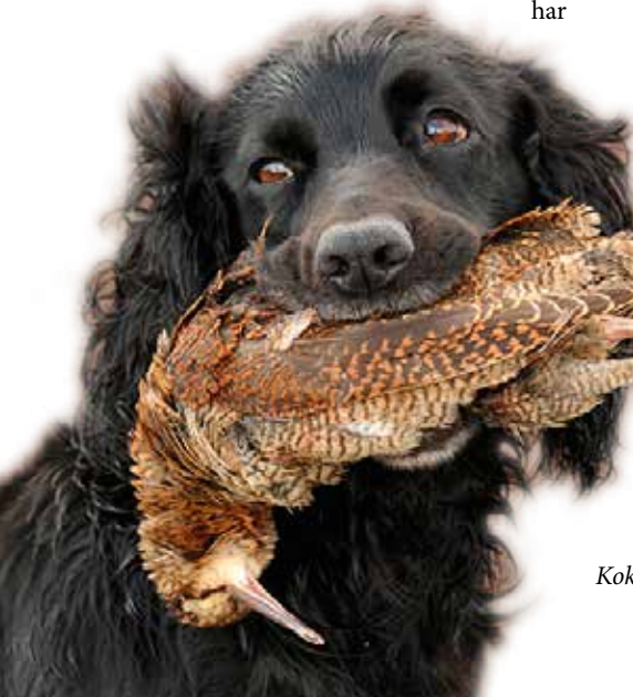
Kokos med rugdeapport, Birkeland 2012.

I NJFFs tidsskrift Jakt & Fiske sitt oppslag om Årets Jakthund (Jakt & Fiske nr 9/2013) ble også Kokos behørig omtalt. Jakt & Fiske avslutter med denne oppfordringen til leserne; ”Ønsker du en samarbeidspartner med stor jaktlyst, og som jobber ”tett på”, er working cocker en rase mange bør kikke nærmere på.”