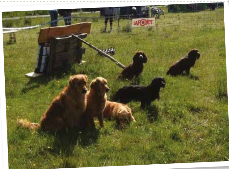
Spaniels og retrievere venter på jakthund-demo.