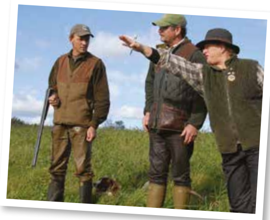
Aurskogprøven og Rugdeprøvene i Rogaland

På Rogalandsprøven er vi jo godt vant og kjenner terrenget både fra egen deltakelse og fra tidligere dommeroppdrag. De siste tre årene har det vært svært bra med fugl, i motsetning til da